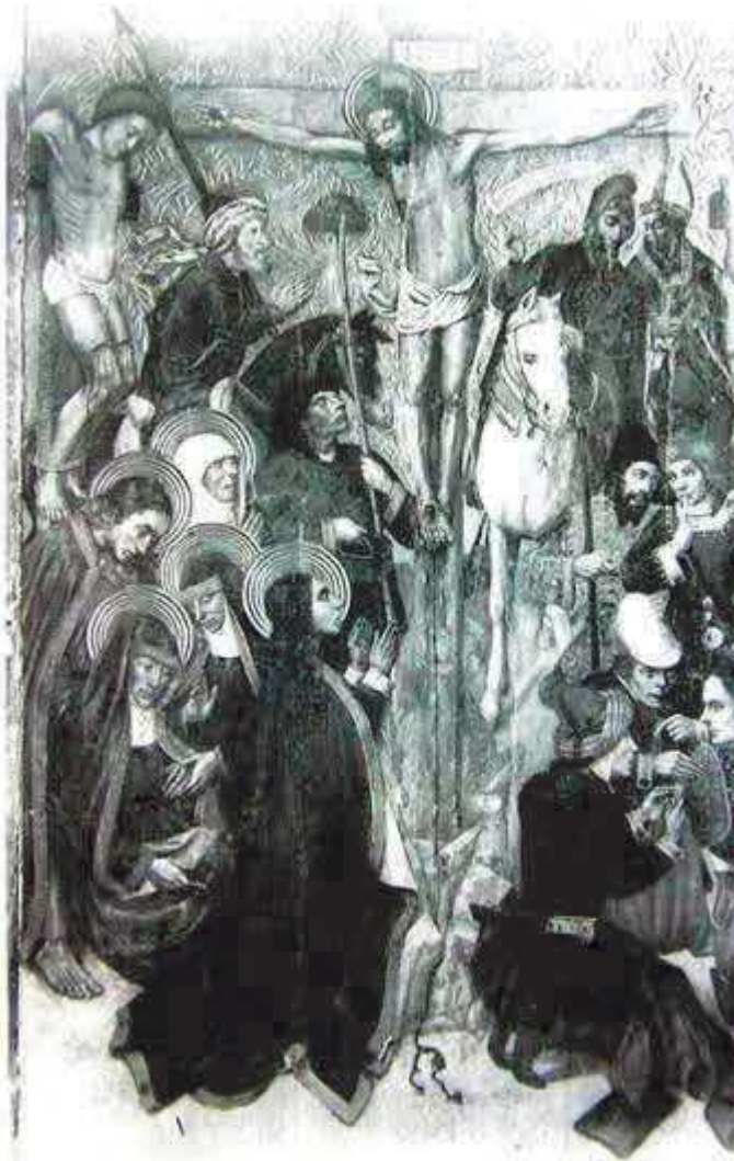
Una de les imatges del retaule de Jaume Huguet