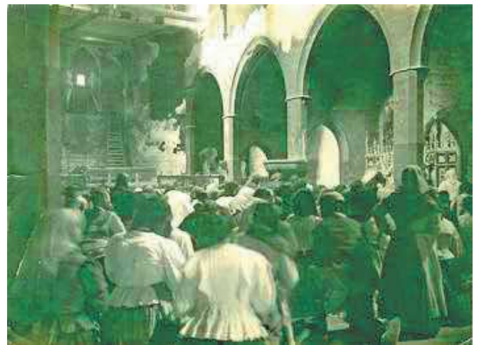
Eucaristia celebrada després de la «setmana tràgica»